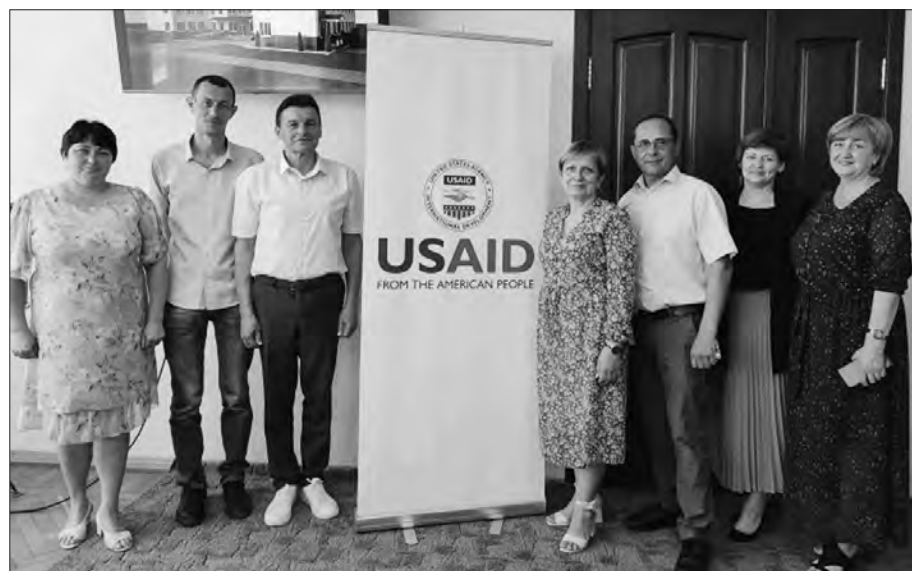
Учасники церемонії підписання договору.